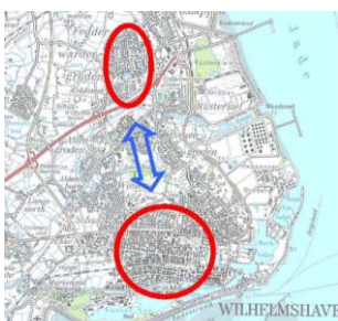
Leitbild „Bipolare Stadtstruktur“

Das Programm „Stadtumbau West“ wurde in den ersten Jahren - vor Umwandlung in ein Regelprogramm der Städtebauförderung - im Rahmen des Experimentellen Wohnungs- und Städtebaus/ExWoSt durch das Bundesbauministerium gefördert und vom Bundesamt für Bauwesen und Raumordnung begleitet. Es hatte zum Ziel, die von den nun auch verstärkt in den alten Bundesländern auftretenden Verlusten an Einwohner/-innen, Unternehmen und Arbeitsplätzen verursachten stadtplanerischen Konsequenzen zu analysieren und auf dieser Grundlage Verfahren und Maßnahmen zu erproben, die geeignet schienen, Stagnations- bzw. Schrumpfungprozesse stadtverträglich zu gestalten. Damit sollte der Frage nachgegangen werden, wie die Anpassung an diese neuen Entwicklungen vor Ort aussehen und wie diese gesteuert werden kann.